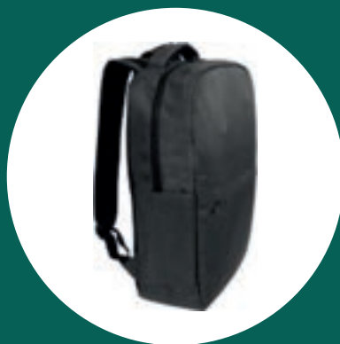
Morral "Singapur" + 900 puntos