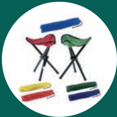
Silla de camping + 220 puntos