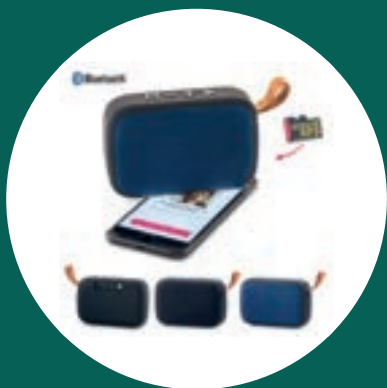
Speaker Bluetooth Rocco + 700 puntos