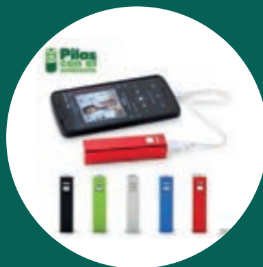
Pila Recargable Power Bank Con Botón 2200mAh + 150 puntos