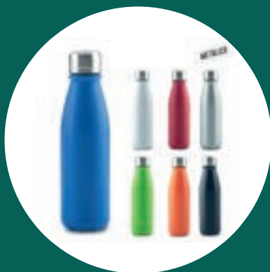
Botillito Metálico Hans 600ml + 100 puntos