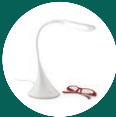
Lámpara USB Swan + 350 puntos