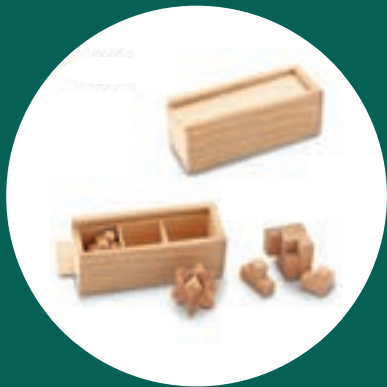
Set de Juegos Genium + 400 puntos