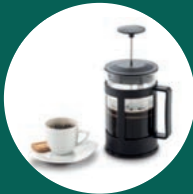
Cafetera en Vidrio 600ml + 550 puntos